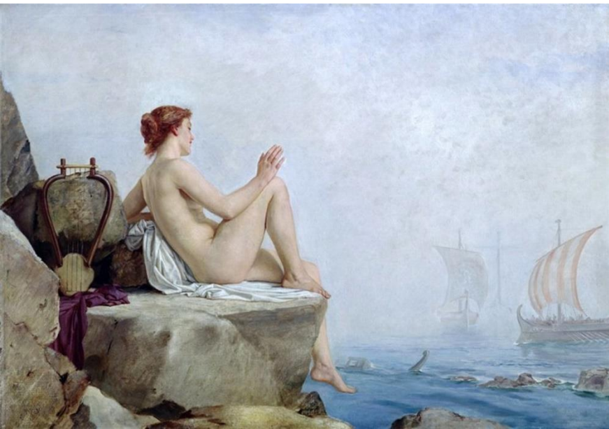
Edward Armitage Armitage Siren (1888)