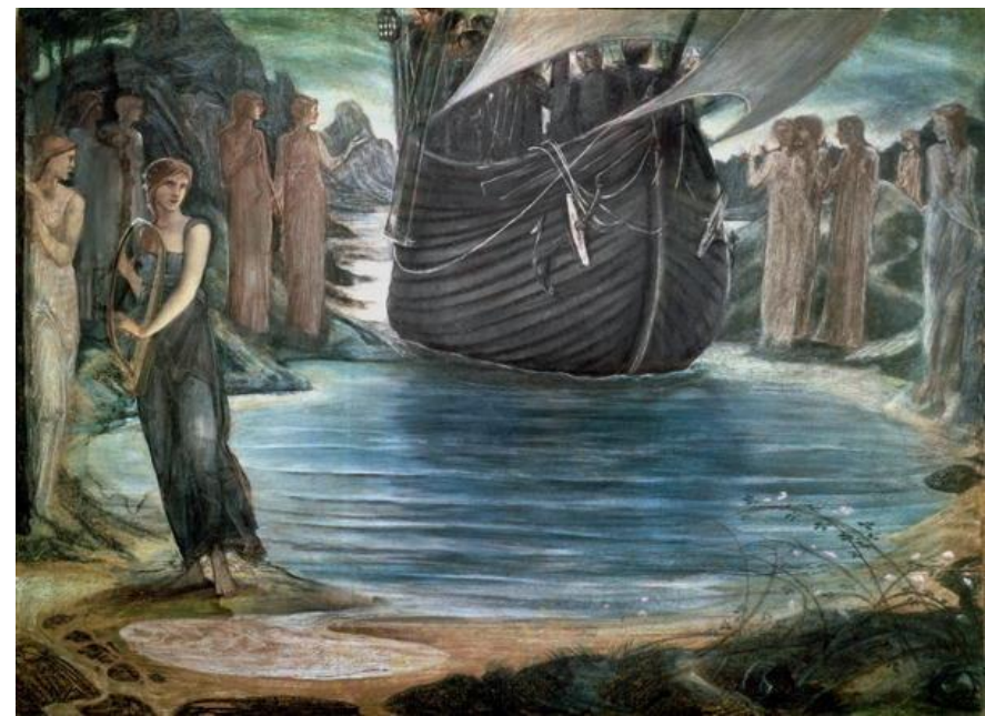
Edward Burne-Jones The Sirens (1875)