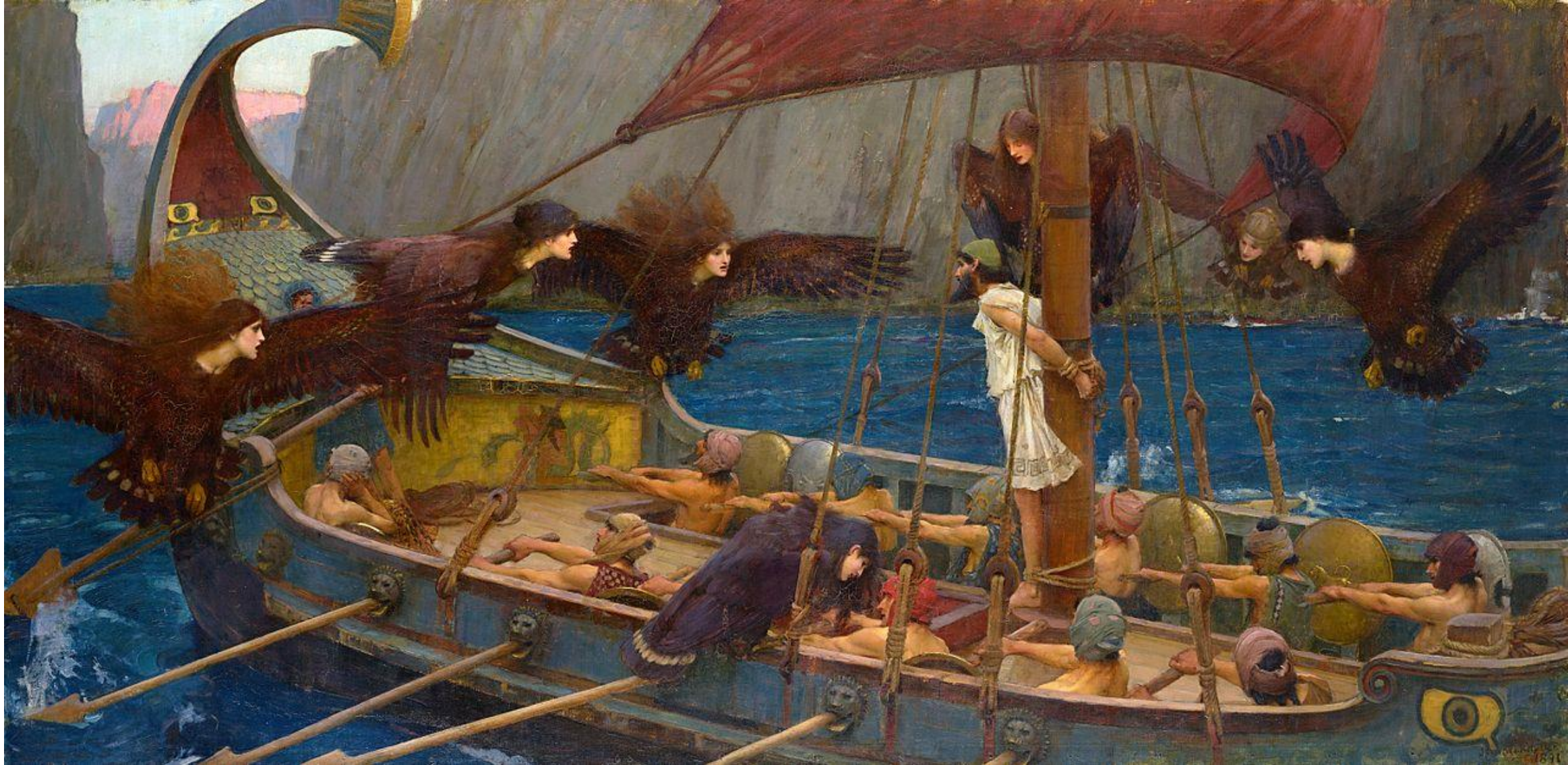
John William Waterhouse: Odüsszeusz és a Szirének, 1891