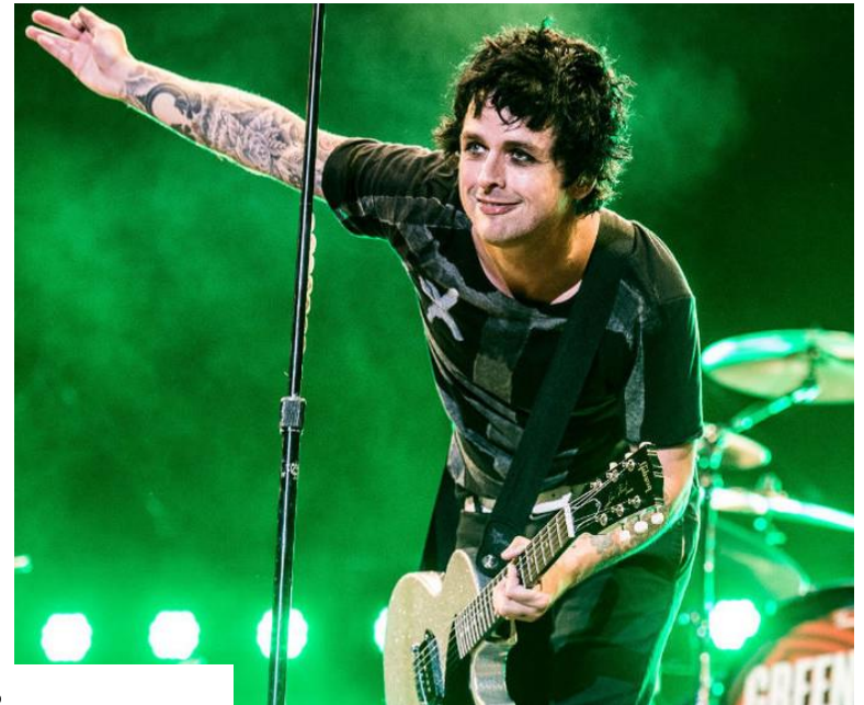
Polgárpukkasztó megjelenés, atonális zene