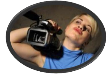
Video film makers